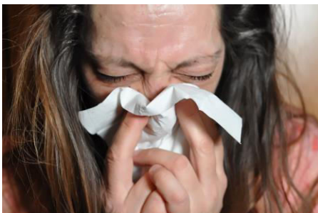
持续性咳嗽和打喷嚏