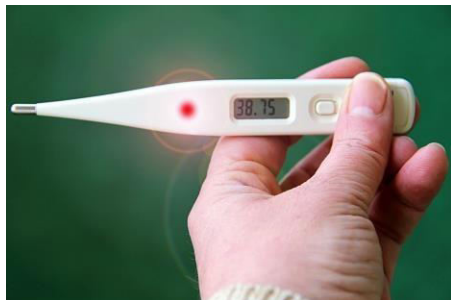
喉咙疼痛伴随发热