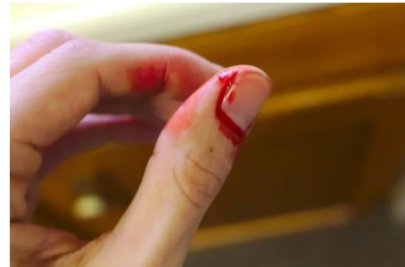
伤口感染或暴露于外